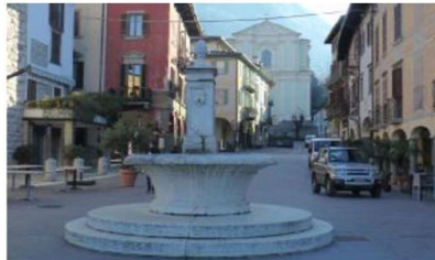
La creazione del «sentiero dell'acqua» sarà sostenuta da Cogeme