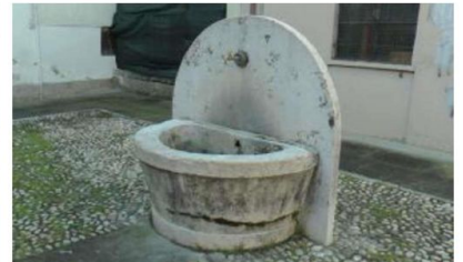
Le fontane diventeranno una vera e propria attrazione turistica

La prospettiva del cuore del paese sarà più suggestiva grazie al restauro delle opere d'arte «idriche»