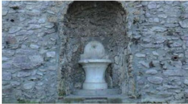
Il restyling riguarderà anche la frazione di Gratacasolo